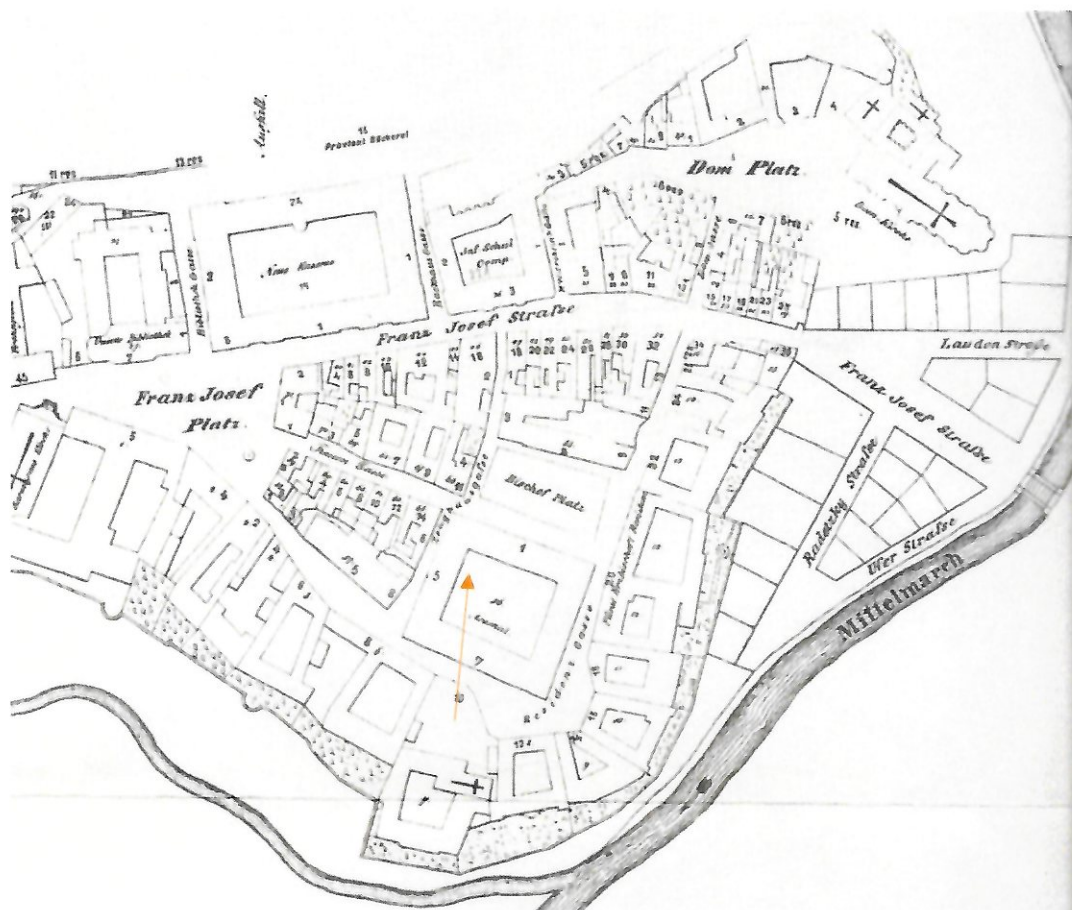
19. století – Olomouc Natherova kniha olomouckých domů (šipka definuje sledovaný objekt)

Olomoucké barokní opevnění, dodnes takřka intaktně dochovaná památka, se systémem pevnůstek a předpolí, má svůj ideový prazáklad v předrománské a románské době. Původně z hradištních valů a následných gotických hradeb, které obepínaly takzvané „vnitřní město“ a „Předhradí“, kde byly koncentrovány především církevní objekty, byla postupem století vybudována takřka nedobytná citadela.