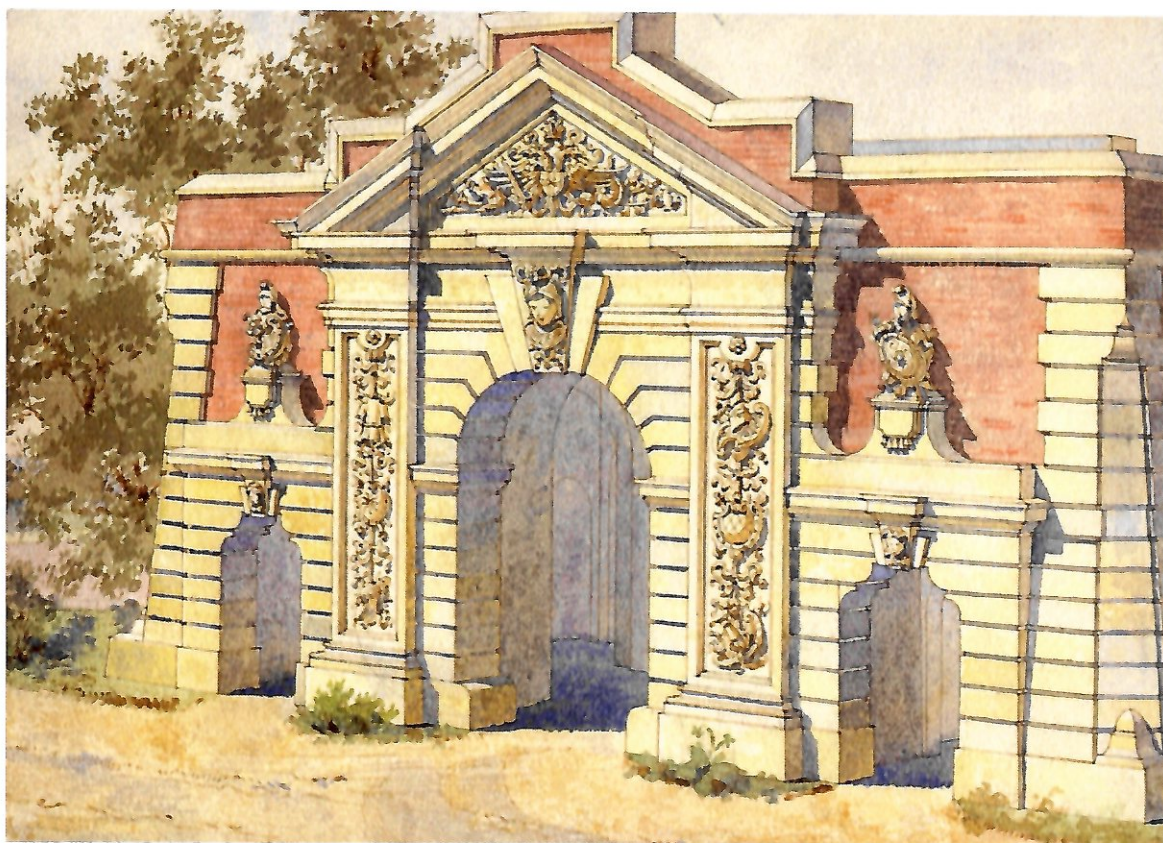
Terežská brána v Olomouci

však také slavnostního vysvěcení právě dokončené olomoucké pýchy – Sloupu Nejsvětější trojice – o čemž do dnešních dnů podává svědectví mramorová pamětní deska nad vchodem do vnitřní kapličky. Že byla Marie Terezie se svým manželem i tentokrát v Olomouci uvítána s nesmírným nadšením, není třeba pochybovat. Dokonce se dá věřit, že se její popularita znovu zvýšila. Ale daleko vyšší hodnoty dosáhla ještě později, ač už její cesty do Olomouce nikdy nevedly. Když jí 4. července 1758 rychlé poselstvo ve Vídni sdělilo, že se před dvěma dny pevnost Olomouc ubránila pruskému vetřelci, neznala její radost mezí. Na místě povýšila všechny své statečné generály, šestnáct členů městské rady olomoucké povýšila na šlechtice a věrnému městu zvláštním privilegiem polepšila na věčné časy jeho znak štítkem s iniciálami F.M.T. (Franciscus - Maria Theresia) na prsou tradiční šachované orlice. Rozhodla také uhradit měšťanům více než 25 tisíc zlatých za škody způsobené nepřátelským obléháním a zvláštním ustanovením nařídila vyplácet Olomoučanům ze státní pokladny 800 zlatých při každoročních oslavách se střeleckým zápolením měšťanského ozbrojeného sboru vždy první neděli po 2. červenci. Olomoučané